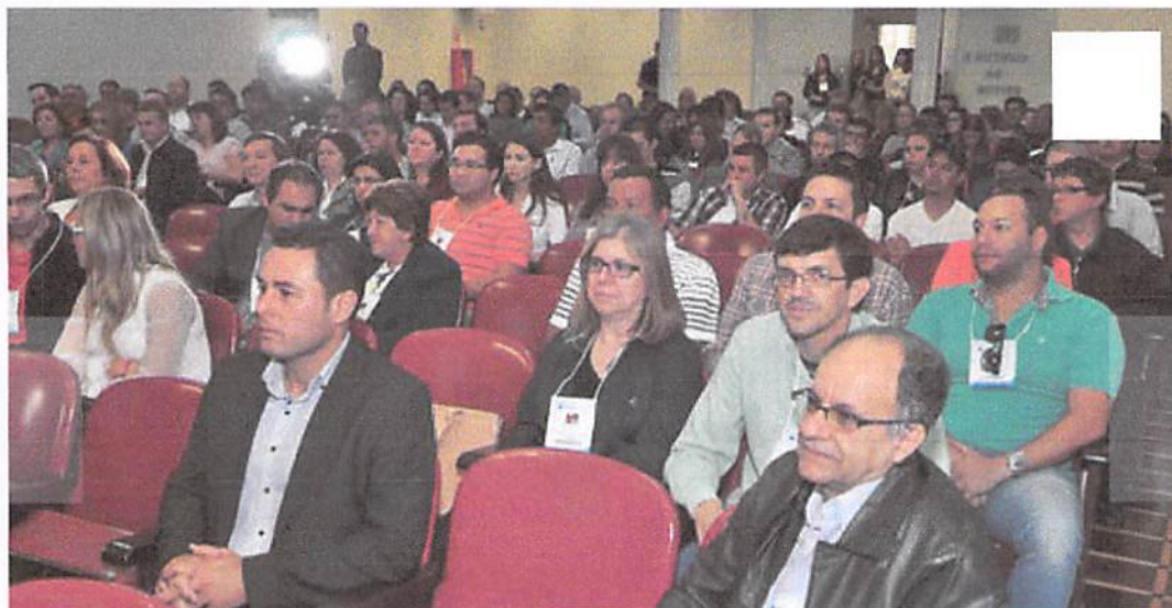
TCE orienta prefeituras sobre prestação de contas

Publicado por imprensa em Terça-feira - 24/03/2015 - 11:21