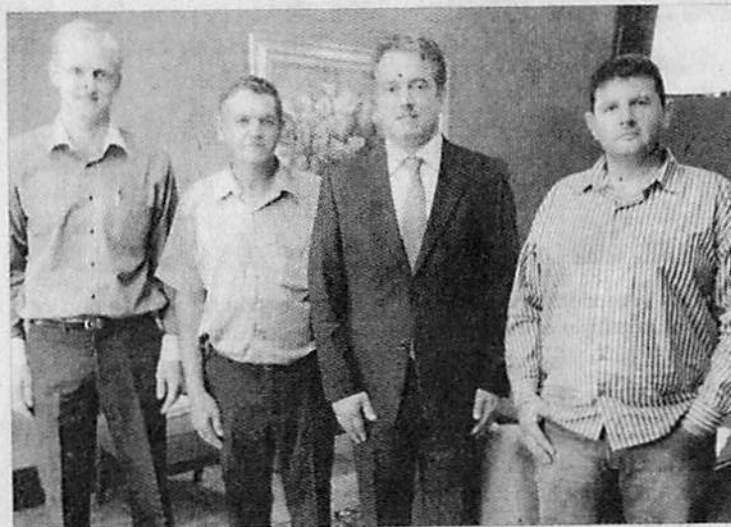
Encontro. Membros do Legislativo de Ipiranga estiveram ontem na Assembleia pleiteando melhorias ao deputado Plauto

Por meio de ofício, os vereadores solicitaram ao parlamentar a realização de obras na rodovia estadual Jean Maurice Faivre, que liga os municípios de Ipiranga e Ivaí. Entre elas a melhoria da estrada que, por ser de terra, encontra-se em estado precário de conservação; o alargamento de uma ponte existente na localidade rural de Coatis;